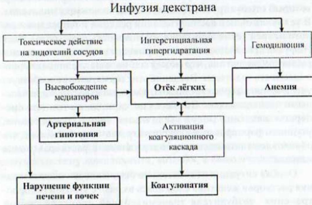
Рисунок 4. Механизмы развития декстранового синдрома

восполнения объёма циркулирующей плазмы.