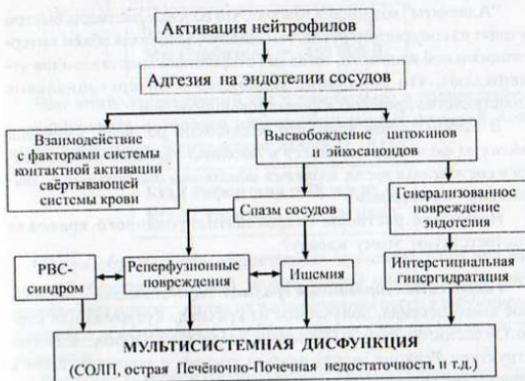
Рисунок 5. Механизм повреждения эндотелия при активации нейтрофилов.

странства. Резко увеличивается онкотическое давление в интерстиции и во внесосудистых пространствах, что приводит к увеличению внесосудистой гипергидратации вообще, и интерстициальному отёку лёгких в частности. Вдобавок происходит сдвиг жидкости внутрь клетки как результат повышения проницаемости клеточной мембраны для натрия. У больных сепсисом иногда появляется, казалось бы, совершенно неожиданная полиурия, которую можно объяснить ухудшением концентрационной способности почек. Уменьшение внутрисосудистого объёма сопровождается увеличением объёма жидкости в интерстициальном пространстве, что ухудшает тканевую оксигенацию, поскольку затрудняет транспорт энергетических субстратов и метаболитов. Можно ли в этих условиях рассчитывать на терапевтический эффект коллоидных растворов с низкой и средней молекулярной массой (альбумин, плазма, декстраны)? Безусловно, что в этих условиях