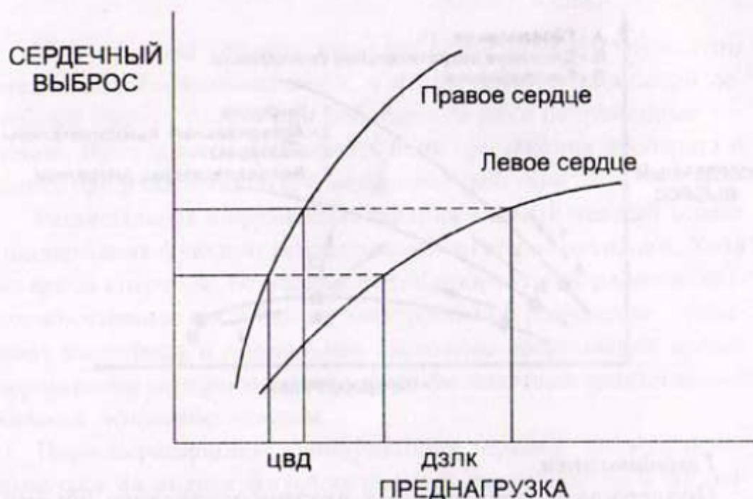
Рисунок.2. Сопоставление изменений ЦВД и ДЗЛК в зависимости от динамики преднагрузки.

кровообращения, так как давление в полости желудочка при критических состояниях не всегда является достоверным показателем преднагрузки.