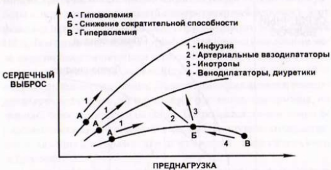
Рисунок 1. Кривые Франка-Старлинга в различных условиях (внизу – гипокинезия, в середине – норма, сверху – гиперкинезия).